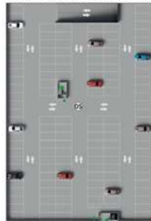
EDIFÍCIO GARAGEM QUARTO PAVIMENTO