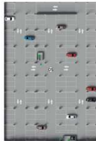
EDIFÍCIO GARAGEM SEGUNDO PAVIMENTO E TERCEIRO PAVIMENTO